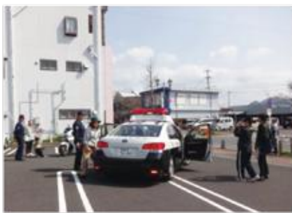
パトカー・白バイの展示 ＝ゆめびか本町通り

交通安全大作戦をテーマにパトカー・白バイの展示があり、スケッチ大会も行われました。