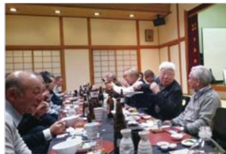
新年会の様子=松屋旅館

一月二十五日(木)松屋旅館にて、新年会を開催しました。美味しい料理・お酒に舌鼓、恒例のビンゴゲーム大会も大いに盛り上がりました。