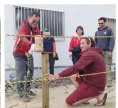
オリーブ植栽の様子 ＝「砂丘の杜」きんぼう