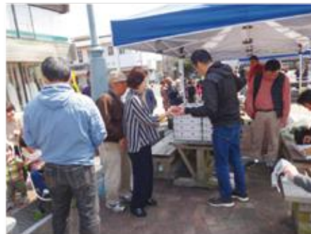
大安売り！イチゴ100円!! ＝ゆめびか本町通り

三月二十四日(土)、南さつま百円商店街第三十二回「えびす百緑市」(主催・加世田本町通商店街振興組合)が、加世田本町通りを中心に、万世・小湊・金峰地区で開催されました。