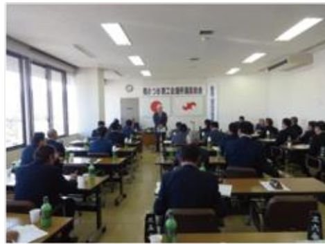
第313回議員総会の模様 ＝商工会議所2階会議室

三月二十八日(水)通常議員総会が、当商工会議所二階会議室で開催され、議案はすべて原案通り承認可決されました。