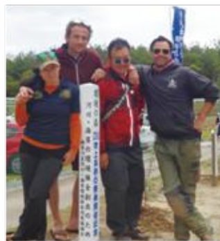
植栽後記念撮影 ＝「砂丘の杜」きんぼう

また、吹上浜砂の祭典期間中には、地元企業・団体の環境美化活動を紹介した「環境フェアパネル展示」も開催しました。