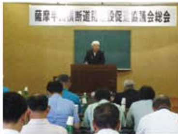
總會の様子＝商工会議所会議室

平成二十八年度事業報告、収支決算報告書及び平成二十九年年度では、薩摩半島横断道路の建設に係る計画ルート案の関係機関等への陳情・要望活動として五月の鹿児島県知事、七月の鹿児島国道事務所、福岡市の九州地方整備局に続き八月には国土交通省などへの要望計画や機運醸成に関する普及啓発看板の南九州市への設置などの事業計画と収支予算書を審議し、原案のとおり承認されました。