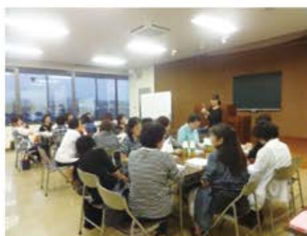
全体会風景＝商工会議所会議室

六月二十日(火)午後七時から商工会議所会議室にて、会員相互の親睦と連携を密にするため、各委員会兼全体会を開催しました。