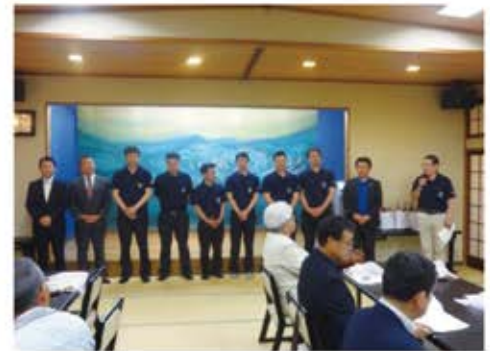
総会後新役員のお披露目＝南村田旅館