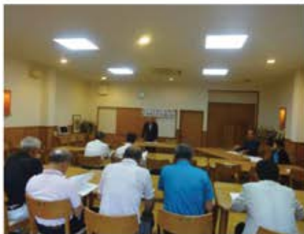
総会の様子＝松屋旅館

六月九日(木)午後六時三十分より、松屋旅館において、平成二十九年年度の総会が開催され、平成二十八年度事業報告並びに収支決算書(案)、平成二十九年年度事業計画(案)並びに収支予算書(案)が審議され、原案通り承認されました。