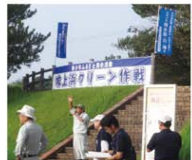
開会式の様子 ＝サンセットブリッジ下駐車場

当協議会は、これからも川や海をきれいにし、河川と海岸の自然環境を守り育てる活動をしていきます。