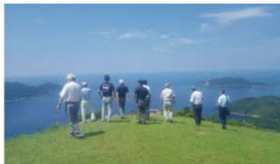
観光視察の様子＝大浦町亀ヶ岡