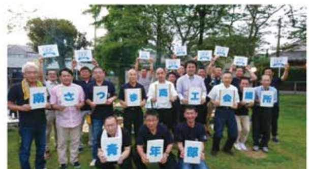
水辺でかんぱーい！＝本町中央公園