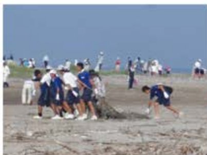
ゴミを拾う様子＝新川海岸

当協議会は、これからも川や海をきれいにし、河川と海岸の自然環境を守り育てる活動をしていきます。