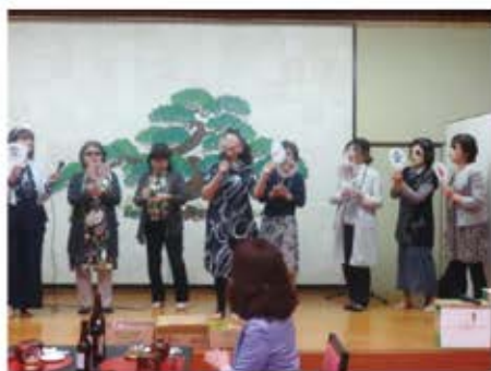
広報委員会のステージ♪＝松屋旅館

平成二十八年度事業報告並びに収支決算(案)、平成二十九年度の事業計画(案)並びに収支予算(案)が審議され、原案通り承認されました。