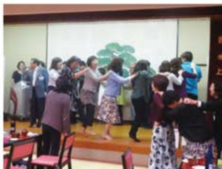
みんなで踊ろうジェンカ♪＝松屋旅館

総会後に行われた懇親会では、委員会ごとにくたを歌ったり、来賓の方に歌ってもらったりと、大変盛り上がりました。