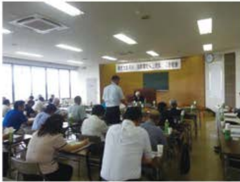
総会の様子＝商工会議所会議室

平成二十八年度事業報告及び収支決算報告、二十九年度は①環境フェアパネル展示②「河川・海岸愛護普及啓発」ポケットティッシュ配布事業③「ふるさと美化活動」海岸清掃④「環境の森」整備事業⑤内水面漁業協同組合の調査・研究⑥河川・海岸等環境美化活動推進に係る要望・陳情などを主事業とする事業計画案並びに収支予算案を審議し、原案通り承認されました。