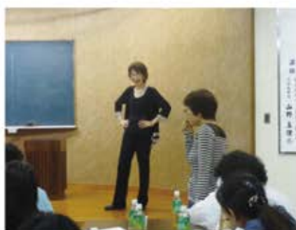
ファッションショーの様子 ＝商工会議所会議室

お弁当を食べ、腹ごしらえをしてから、委員会ごとに議題について話し合い、協議結果を報告しました。また、音楽を流しながら今日のファッションのポイントなどを発表する、ファッションショーも行われました。女性ならではの様々なこだわりが参考になりました。