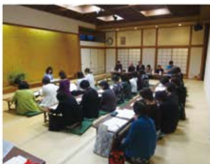
総会風景＝松屋旅館

五月十六日(火)午後七時より松屋旅館にて、平成二十九年度の総会を開催いたしました。