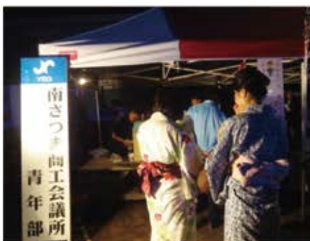
出店風景＝ゆめびか本町通り

八月七日(月)に開催された、第四十五回加世田ゆめびか本町七夕まつりに出店し、一夜限りの祭りを盛り上げました。