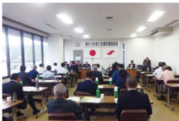
第311回議員総会の様子 ＝商工会議所会議室（写真右）