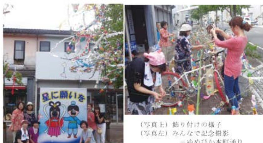
(写真上) 飾り付けの様子 (写真左) みんなで記念撮影 ＝ゆめびか本町通り

八月五日(土)から三日間開催予定が、台風接近のため七日(月)のみの開催となった、『七夕まつり』に、七日午前十時から大原百貨店前に集まり、飾り付けを行いました。「創作七夕コンテスト優勝」に向けて、全員で気合を入れて準備していただけに残念でしたが、一日限りの七夕まつりを盛り上げることができました。