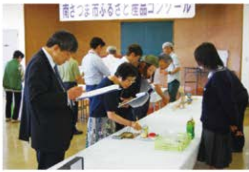
審査会風景=商工会議所会議室

今後とも様々な機会を通じて、今回の出品製品をはじめとする南さつま市の地元特産品のPRに努めていきます。