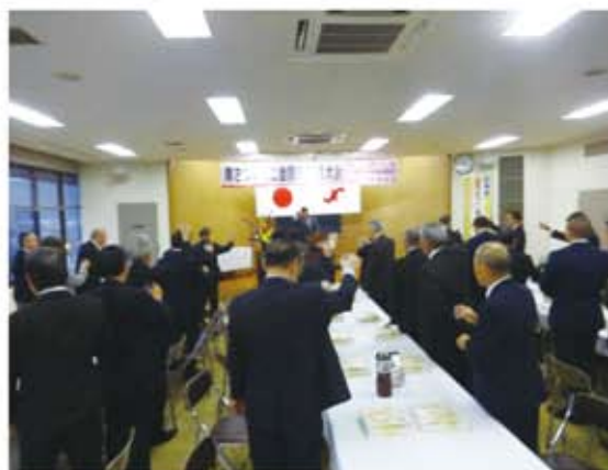
懇親会の様子＝商工会議所会議室

午後五時三十分より、懇親会も開催され、地場産品の焼酎で乾杯した後、南さつま市の特産品を景品にした大抽選会もあり、大いに盛り上がりました。