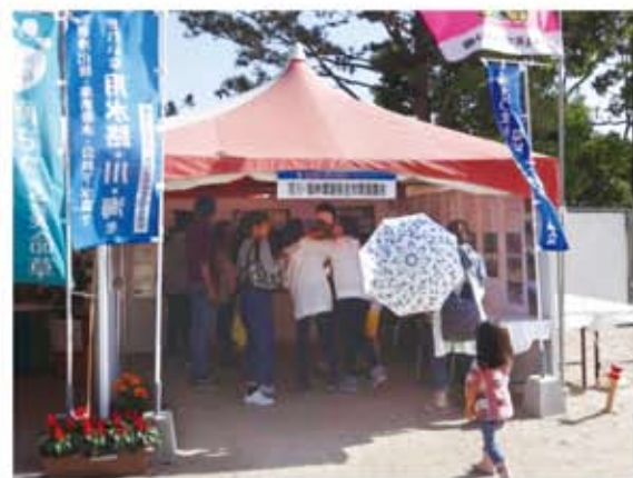
「環境フェアパネル展示」＝「砂丘の杜」きんぼう

また、吹上浜砂の祭典期間中には、地元企業・団体の環境美化活動を紹介した「環境フェアパネル展示」も開催しました。