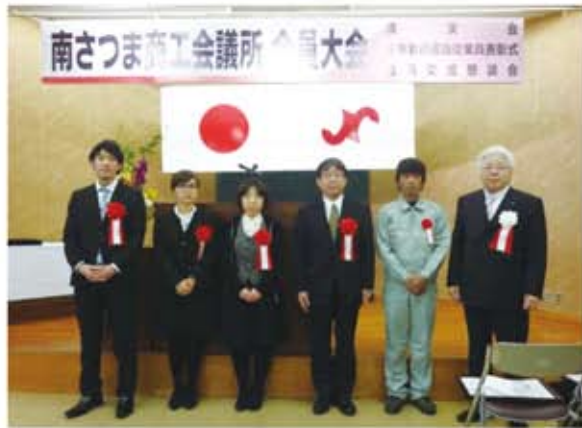
鳥越会頭と受賞された方々＝商工会議所会議室

午後五時三十分より、懇親会も開催され、地場産品の焼酎で乾杯した後、南さつま市の特産品を景品にした大抽選会もあり、大いに盛り上がりました。