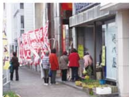
行列ができるお店も！ ＝ゆめびか本町通り

交通安全大作戦をテーマにバイク・白バイの展示があり、スケッチ大会も行われました。