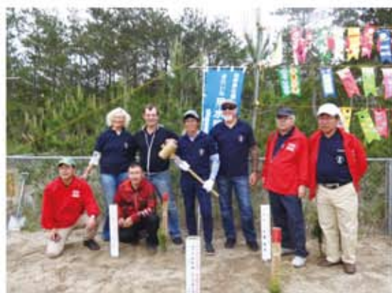
植樹参加者で記念撮影＝「砂丘の杜」きんぼう

また、吹上浜砂の祭典期間中には、地元企業・団体の環境美化活動を紹介した「環境フェアパネル展示」も開催しました。