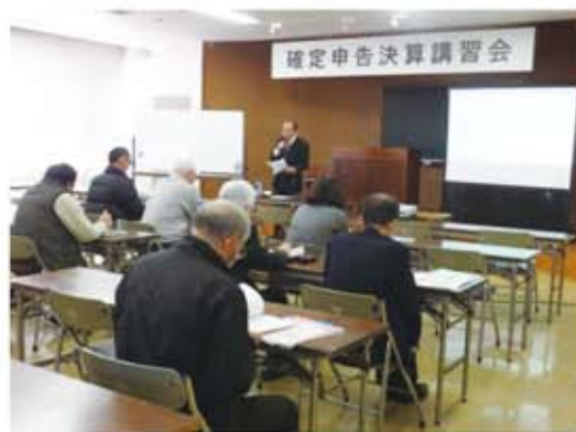
講習会の様子＝商工会議所3階会議室

資料に沿って所得税の決算書と確定申告の作成について注意すべき点や、今年からマイナンバーの記載が始まったこと、小規模企業共済と個人型確定拠出年金による全額所得控除について説明があり、また、パソコンを使用して、国税庁のホームページを紹介し、ウェブ上の確定申告コーナーで作成することで、計算も自動でできるため、ミスがなくなり、保存もでき、便利であると説明がありました。