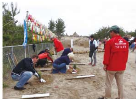
招待作家による記念植樹＝「砂丘の杜」きんぼう

今回は平成二十六年に植樹した箇所の管理整備ということ、金峰町建設同志会、南日本新聞川辺地区南陽会、NPO法人プロジェクト南からの潮流、商工会議所青年部にご協力いただき、合計十八名で草払いを行いました。