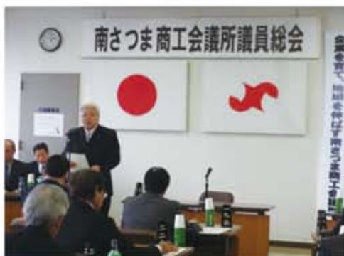
第310回議員総会の模様 ＝商工会議所2階会議室

三月二十九日（水）通常議員総会が、当商工会議所二階会議室で開催され、議案はすべて原案通り承認可決されました。