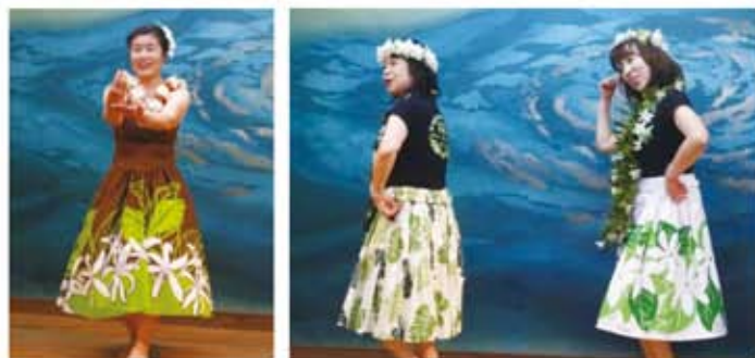
女性会のフラダンスガールズ

また、今回初披露のフラダンスガールズも、鮮やかな衣装と色気のあるダンスで、さらに新年会を盛り上げました。