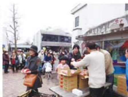
大安売り！イチゴ100円!! ＝ゆめびか本町通り

交通安全大作戦をテーマにバイク・白バイの展示があり、スケッチ大会も行われました。