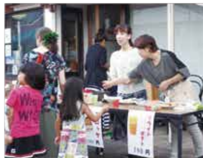
手作りコロケ&ポテト おいしいよ～！ =ゆめびか本町通りステージ

八月五日(金)から七日(日) の三日間、本町通りで行われた『七 夕まつり』に六・七日の二日間出 店しました。六日はトルネードポ テトを、七日はコロケとフライ ドポテトを販売しましたが、二日 間とも即完売となりました。