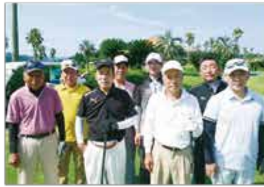
参加者で記念撮影 =湯の浦カントリー

七月二十七日(水)湯の浦カ ントリークラブにて、親睦ゴルフ大 会を開催しました。