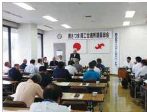
第306回議員総会の様子 ＝商工会議所会議室（写真右）