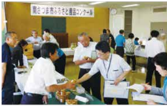
審査会風景＝商工会議所会議室

六月七日(火)、地域資源を活かした特産品の開発や生産技術の向上、地場産業の振興を図るため、南さつま市・南さつま市観光協会・南さつま地域資源活用促進協議会・当所の共催で「南さつま市ふるさと産品コンクール」(協賛：(公社)鹿児島県特産品協会・(公社)鹿児島県観光連盟・南さつま市議会・南さつま市商工会)が開催され、南さつま市内の事業所十三社から十六点の出品がありました。審査会には県特産品協会や県観光連盟、市内関係者など十五名の審査員があたり、出品事業者に