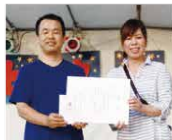
☆金賞☆養徳園通所介護事業所 ＝ポシェット広場特設ステージ