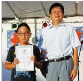
☆最優秀賞☆村原子ども会 プレゼンターの 南日本新聞社勝日支局長と ＝ポシェット広場 特設ステージ