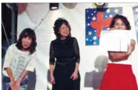
団体戦優勝！=ゆめびか本町通りステージ