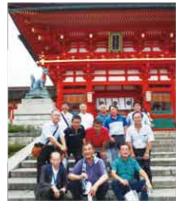
伏見稲荷大社見学風景