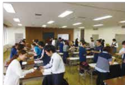
二人一組で名刺交換の練習 =商工会議所会議室