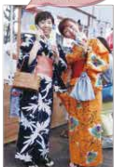
浴衣でご来場の方に かき米のプレゼント!