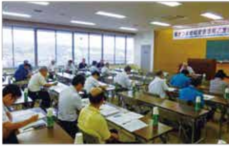
総会の様子＝商工会議所会議室

平成二十七年事業報告及び収支決算報告、二十八年度は①「食と酒と物産 2016 in 品川」への参加、出店②さつま・すんくじら東京スタッフとの交流③販路拡大業務④特産品の紹介、PRのためのホームページ作成⑤講演会・セミナー等の開催⑥加世田麓のまち歩きへの協力⑦南さつま市ふるさと産品コンクールへの支援・協力などの事業計画並びに収支予算を審議し、異議なく了承されました。