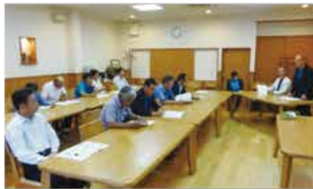
総会の様子=松屋旅館

事業報告並 びに収支決 算書(案)、 平成二十八 年度事業計 画(案)並 びに収支予 算書(案) が審議され、 原案通り承 認されました。