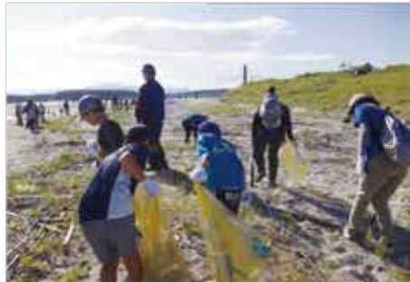
ゴミを拾う様子=新川海岸

当協議会は、これからも川や海をきれいにし、河川と海岸の自然環境を守り育てる活動をしていきます。