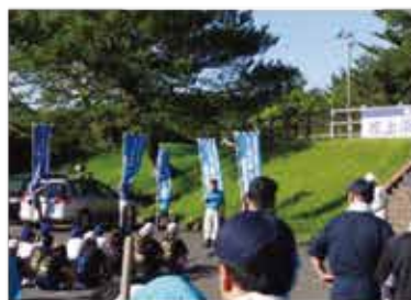
開会式の様子 =サンセットブリッジ下駐車場