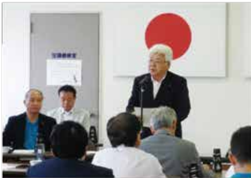
開会挨拶をする鳥越会頭 ＝商工会議所会議室（写真上）