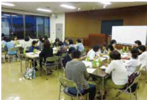
全体会風景=商工会議所会議室

お弁当を食べ、腹ごしらえをし てから、委員会ごとに議題につい て話し合い、協議結果を報告しま した。