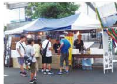
出店風景=ゆめびか本町通り

七夕飾りやステージを、串焼きや 生ビール、焼酎等で、より一層楽 しむお客さんで賑わっていました。