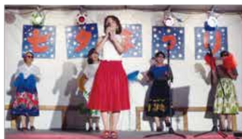
団体戦☆優勝☆南さつま商工会議所女性会 ＝ポシェット広場特設ステージ