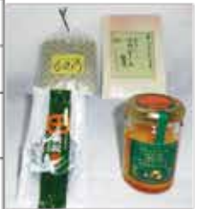
(右下) たんかんジャム (左下) 常潤院 (右上) つわぶきの佃煮 (左上) らっきょうせんべえ