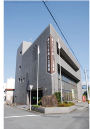
(写真) 当所会館外観

商工会議所の活動には、大企業も中小企業も、みんなの力を合わせて、地域を住みやすく、働きやすいところにしてほしいという念願が込められています。