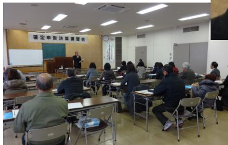
講習会の様子= 商工会議所 3階会議室

資料に沿って所得税の決算書と確定申告の作成について注意すべき点及び税制改正により変更のあった通勤手当の非課税枠等の説明がありました。また、消費税については税率引上げに伴う集計方法、任意の中間申告制度等、変更のあった事項の説明がありました。参加者は熱心に聴講していました。