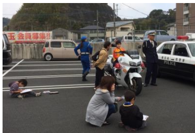
スケッチ大会の様子 ＝（株）加世田京極駐車場

「交通安全大作戦」として（株）加世田京極駐車場にて、パトカー展示と小学生以下を対象にした「春よ来い！商店街スケッチ大会」が開催されました