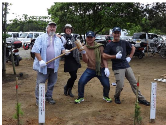
招待作家による記念植樹＝「砂丘の杜」きんぼう

今回は補植・管理という事で、昨年植樹した箇所の草払いと約三十本の抵抗性クロマツ「スーパードリンスつま」の補植を行いました。また、五月一日（金）2015吹上浜砂の祭典オープニングセレモニー後、招待作家四名による記念植樹も開催しました。