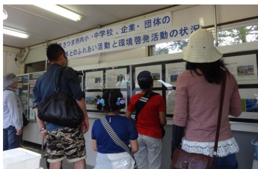
「環境フェアパネル展示」 ＝「砂丘の杜きんぼう」展示コーナー

また、吹上浜砂の祭典期間中は、地元小学校の河川・海岸ふれあい活動や学習、企業・団体の環境美化活動を紹介した「環境フェアパネル展示」も開催しました。