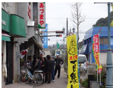
行列ができるお店も ＝ゆめびか本町通り

南さつま百円商店街第二十六回「えびす百縁市」（主催：加世田本町通商店街振興組合）が三月二十一日（春分の日）、加世田本町通りを中心し万世・小湊・金峰地区で開催されました。