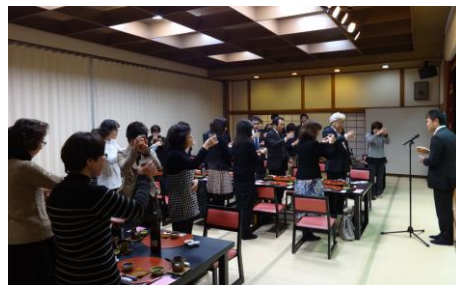
全員でカンパイ！=松屋旅館

今回は、委員会対抗のど自慢大会を開催し、委員会ごとに練習の成果を十分に発揮し、大いに盛り上がりました。