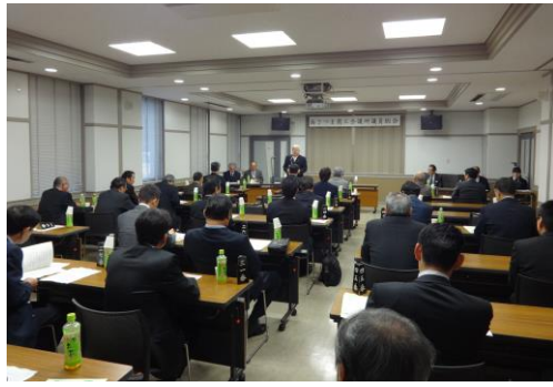
第302回議員総会の模様 ＝ふれあいかせだ会議室

三月十九日（木）通常議員総会が、ふれあいかせだ会議室で開催され、議案はすべて原案通り承認可決されました。