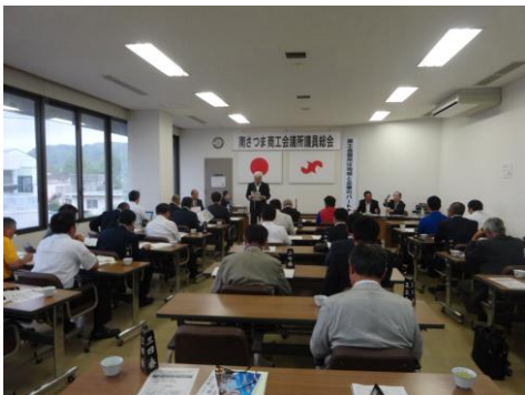
第300回議員総会の様子 ＝商工会議所会議室