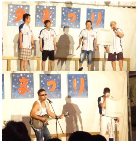
団体戦☆優勝☆(有)南薩東京社の皆さん ＝ポシェット広場特設ステージ