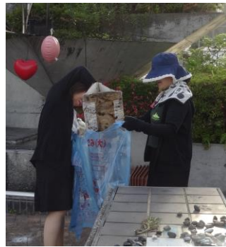
ゴミを拾う様子＝ゆめびか本町通り

五月二十八日(水)全国一斉に開催された住民総参加型スポーツイベント『2014チャレンジデー』に当所職員も参加しました。終業後、職員全員で本町周辺をウォーキングしながらゴミ拾いをし、いい汗を流しました。