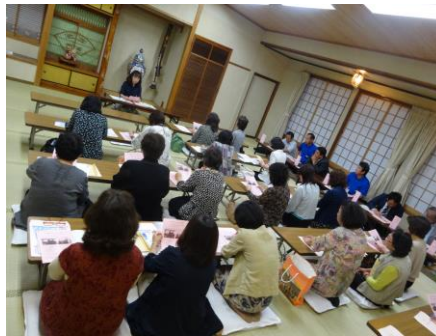
総会風景 = (有)村田旅館

五月二十七日（火）午後七時より（有）村田旅館にて、平成二十六年の総会を開催いたしました。平成二十五年事業報告並びに収支決算（案）、平成二十六年の事業計画（案）並びに収支予算（案）が審議され、原案通り承認されました。