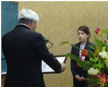
鳥越会頭より会頭賞の授受＝商工会議所会議室

六月二十六日(木)に開催しました、南さつま商工会議所第三百回通常総会において「南さつま市ふるさと産品コンクール表彰式」が行われ、受賞された出品事業所に表彰状・楯が授与されました。