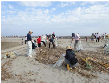
ゴミを拾う様子＝新川海岸

サンセットブリッジ下の駐車場が開会式をした後、全員で新川海岸に移動し、ゴミ袋と軍手を受け取った後、各自ゴミを見つけたら歩き、袋いっぱいになっていました。空き缶、ペットボトル、ゴム製品等、たくさんゴミを拾い、最後も全員で閉会式を迎えました。