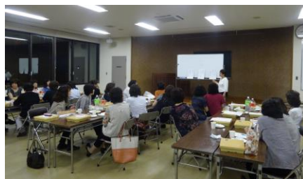
教養講座「川柳」「さつま狂句」「俳句」披露！お題は『女の一生』 = 商工会議所会議室

六月二十四日（火）午後七時から商工会議所会議室にて、会員相互の親睦と連携を密にするため、各委員会兼全体会を開催しました。お弁当を食べ、腹ごしらえをしてから、委員会ごとに議題について話し合い、協議結果を報告しました。その後は、お茶をしながら教養講座の作品を発表し、お腹いっぱい笑顔いっぱい、楽しいひとときを過ごしました。