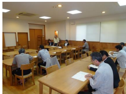
総会風景=松屋旅館

六月十三日(金) 午後六時三十分より、松屋旅館において、平成二十六年の総会が開催され、平成二十五年事業報告並びに収支決算書(案)、平成二十六年事業計画(案)並びに収支予算書(案)が審議され、原案通り承認されました。