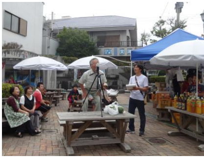
大声で暑さを吹き飛ばせ！ ＝ポシェット広場

今回は、大声おらぼう大作戦と銘打って、ポシェット広場にて、大声を出して「暑さ」「不景気」を吹き飛ばそうと、二歳から六十六歳までの参加者に、夢や想い・感謝を大声で叫んでもらい、音量測定器の数値の大きさを審査し、子どもにはすいかやジュース、大人には焼酎等の景品が手渡されました。