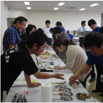
審査会風景＝商工会議所会議室

六月四日(水)、地域資源を生かした特産品の開発や生産技術の向上、地場産業の振興を図るため、南さつま市・南さつま市観光協会・当所の共催で「南さつま市ふるさと産品コンクール」(協賛:(公社)鹿児島県特産品協会・(公社)鹿児島県観光連盟・南さつま市議会・南さつま市商工会)が開催され、南さつま市内の事業所十六社から二十五点の出品がありました。審査会には県特産品協会や県観光連盟、市内関係者など十五名の審査員があたり、出品事業者に製品の特徴やセールスポイントなどをたずねて、試食・試飲をしながら、「地域資源等の活用・創意工夫・売れ行きの期待度」などの項目について厳正な審査が行われ、下記のとおり結果となりました。