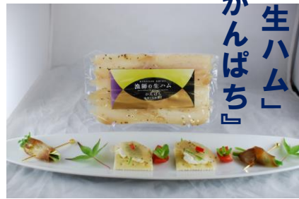
(有)ヤマチヨウの『漁師の生ハム』カンパチ

六月二十六日(木)に開催しました、南さつま商工会議所第三百回通常総会において「南さつま市ふるさと産品コンクール表彰式」が行われ、受賞された出品事業所に表彰状・楯が授与されました。