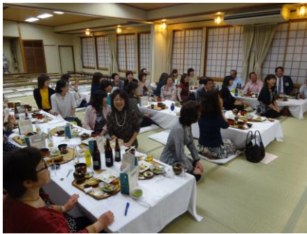
懇親会風景 = (有)村田旅館