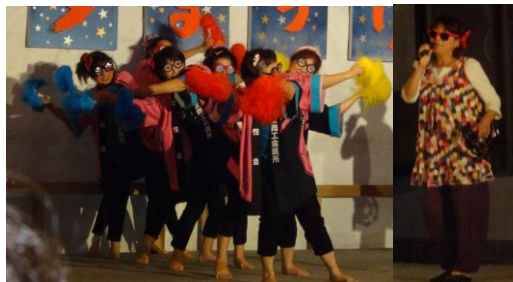
謎のダンサーズ「おどるポンポコリン」 = ゆめびか本町通りステージ

八月七日（木）本町通りで行われた七夕まつりの「職場対抗カラオケ歌合戦」に参加しました。二ヶ月も前からアイデアを出し合い、練習に練習を重ね、息の合ったダンスも披露し、応援にかけつけた会員の力も借りて、見事個人優勝をもち取りました。