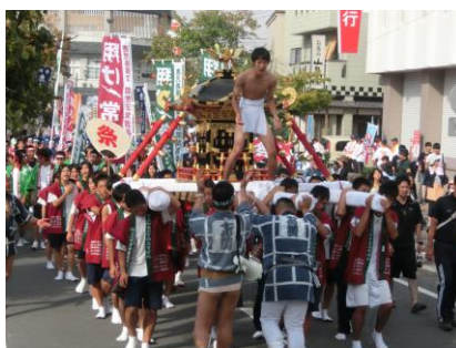
昨年の大神輿パレードの様子 ＝ゆめぴか本町通り

来る九月二十三日(火)秋分の日、「2014南さつまフェスタふるさと総踊り」が開催されます。当所も大神輿パレード、青年部のボンボン釣り、女性会のバザー、総踊りのふるまい酒等、参加・協力いたします。皆様のお越しを心よりお待ちしております。