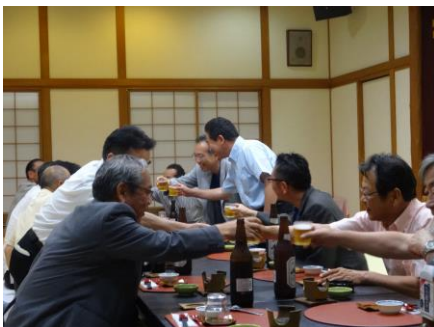
懇親会風景=松屋旅館

総会終了後に懇親会も行われ、会員の親睦を図りながら、美味しい料理やお酒をいただきました。