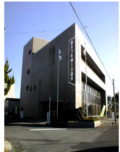
=南さつま商工会議所会館全景