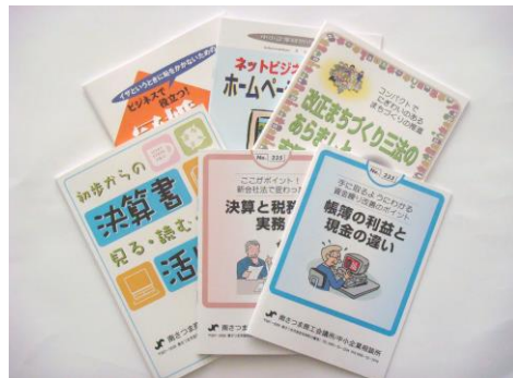
=施策パンフレットの一例