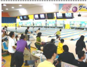
会員親睦事業 ・会員事業所の従業員福利厚生のひとつとしてレクリエーション活動を実施。写真は「ボウリング大会」風景。