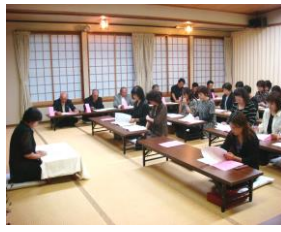
「 女性会 」活動の一例 ・女性経営者や経営者の夫人等で構成する団体、写真は「総会」風景。