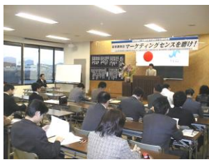
「 青年部 」活動の一例 ・満49歳までの後継者育成等を目的とする団体、写真は「経営講習会」風景。