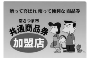
=商品券加盟店ステッカー