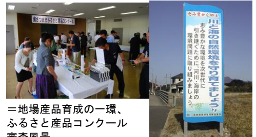
＝地場産品育成の一環、ふるさと産品コンクール審査風景