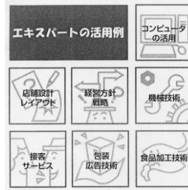
=エキスパートバンクの活用事例