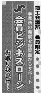
＝ビジネスローンのほり