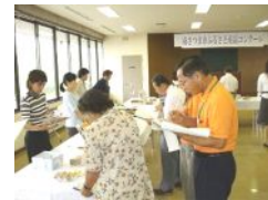
＝地場産品育成の一環、ふるさと産品コンクール審査風景