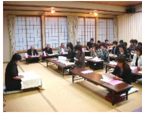
「女性会」活動の一例