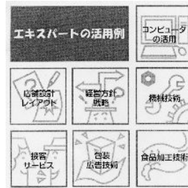
＝エキスパートバンクの活用事例