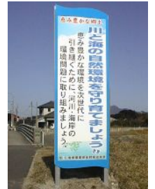
＝環境問題の取組に河川愛護普及啓発看板を設置