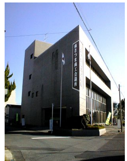
＝南さつま商工会議所会館全景