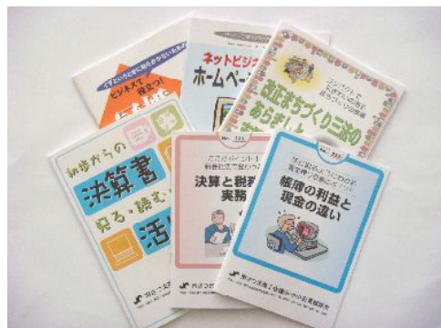
＝施策パンフレットの一例

・会員事業所の従業員福利厚生のひとつとしてレクリエーション活動を実施。写真は「ボウリング大会」風景。