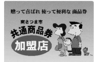
＝商品券加盟店ステッカー