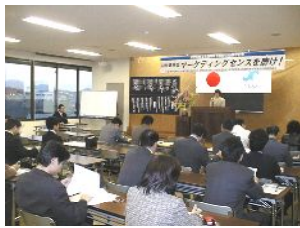
「青年部」活動の一例